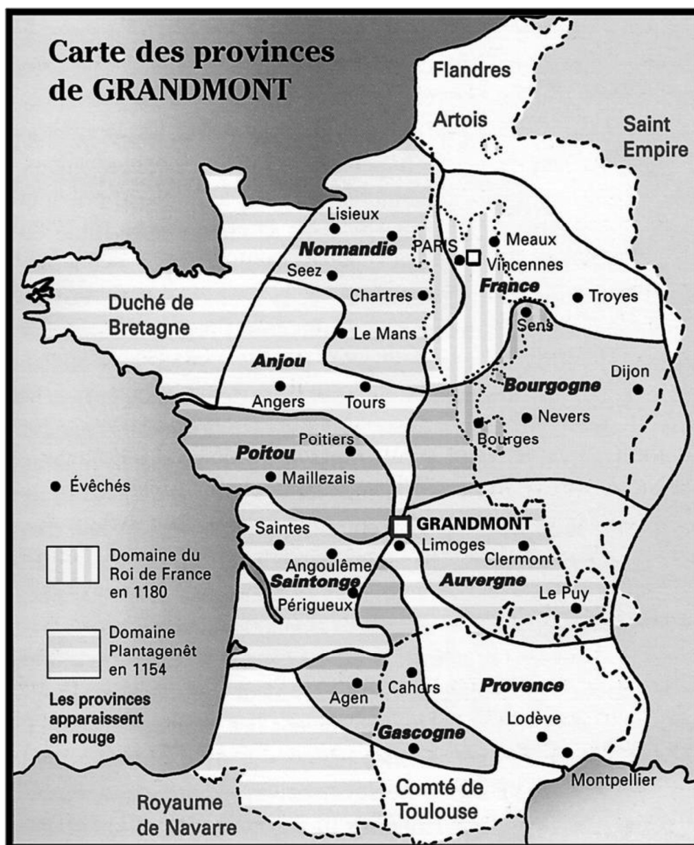
Les 152 celles grandmontaines de France